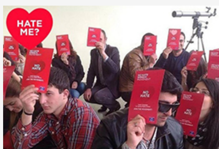
« Fédération des clubs de jeunes d'Arménie »