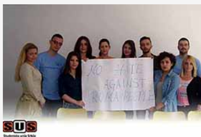
« Etudiants Européens, Belgique »