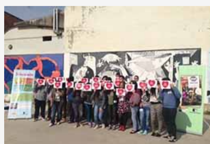
« MCI, Sevilla »