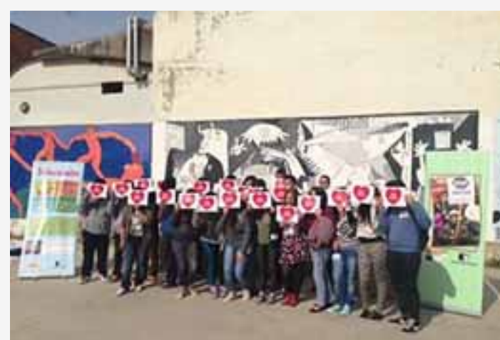
« MCI, Séville »