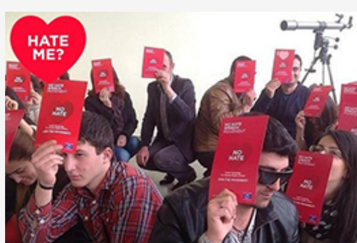
« Federation of Youth Clubs of Armenia »