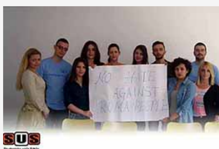
« European Students, Belgium »