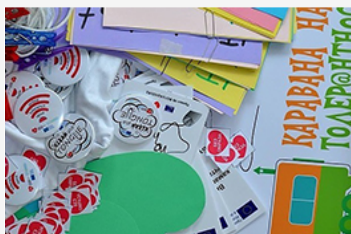
« Ida from Bulgaria »