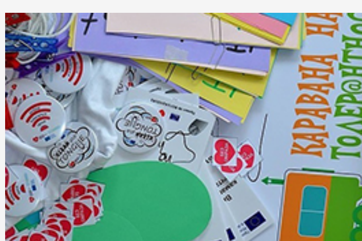
« Ida de Bulgarie »