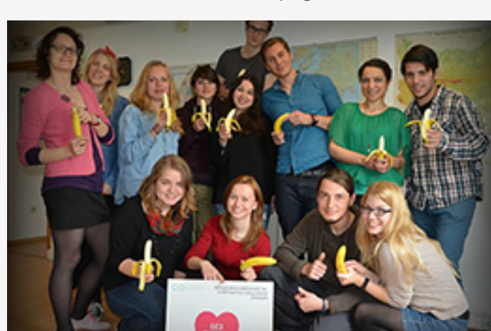
« l'Association Opportunités Infinies, Bulgarie »

N'hésitez pas à nous écrire si vous avez des questions/Idées à partager à l'adresse youth.nohatespeech@coe.int . N'oubliez pas non plus que vous pouvez utiliser notre système de partage d'activités pour nous informer sur les événements qui ont eu lieu récemment dans votre pays au sein de votre organisation !