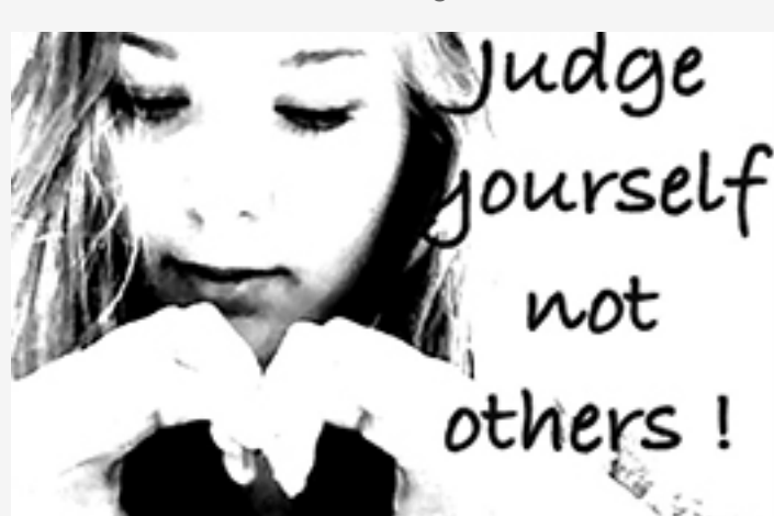
« Josephine d'Allemagne »