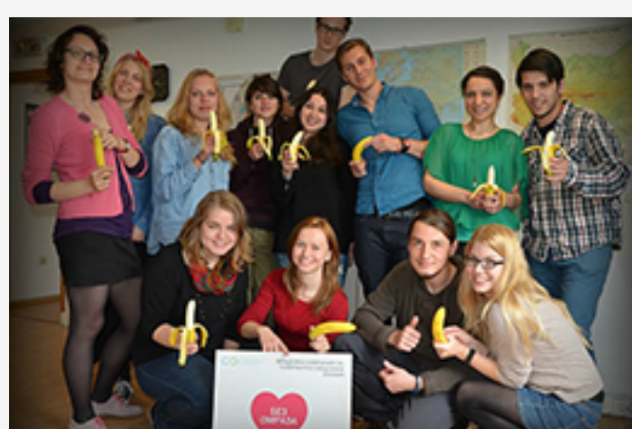
« Infinite Opportunities Association, Bulgaria »

Please don't hesitate to write us for any enquiries/ideas you might have at youth.nohatespeech@coe.int . Don't forget also that you can use our reporting system to spread the word about the activities you've held so far!